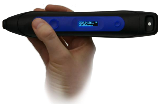
Stylo Multipen NFC/RFID