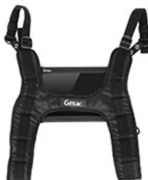
Harnais à fixation à l'épaule