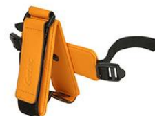
Sangle à main rotative et support pour stylus (inclus)