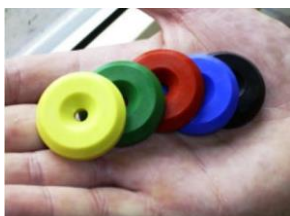
Puces rondes diam. 34 mm AMO-TAG-34