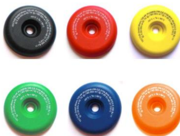
Puces rondes 6 colories