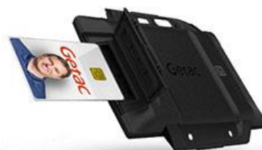
Option lecteur RFID/NFC Référence GORSX2