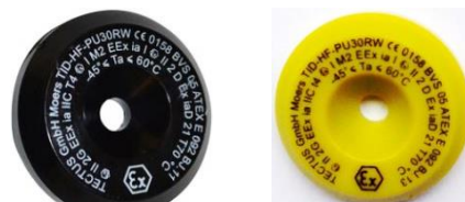
Puces ATEX AMO-TAG-34-ATEX