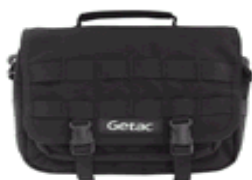
Housse de transport