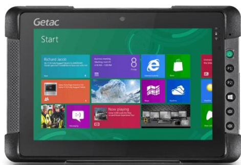
Tablette T800 G2 ATEX