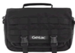
Housse de transport