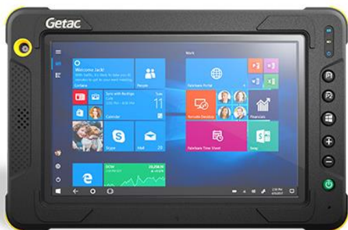
Tablette GETAC EX80