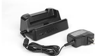
Station d'accueil avec port USB et RJ45 (inclus)