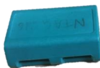
Puces rectangulaires avec fixation par colson